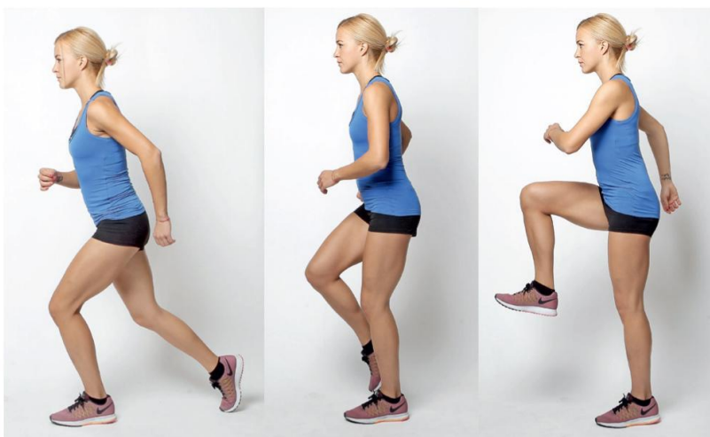
18, 19, 20 IMITACIJA TEKAŠKEGA KORAKA NA MESTU